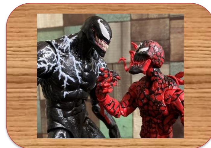
「ヴェノムVSカーネイジ」 こさめ