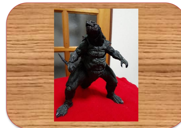
「ゴジラヴェノムフィリウス」 T2