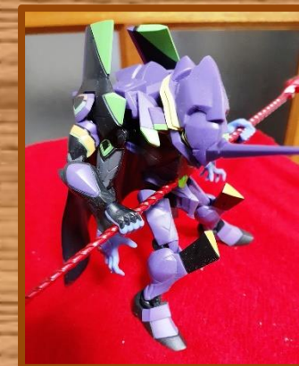
「マイクロエヴァ13号機」 T2